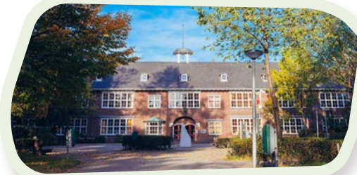
📍 Bovenbouw De Stichtse Vrije School