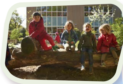
📍 BSO De Bosplaats

Meer informatie over SBO Tobias in Zeist kunt u krijgen via de administratie van de Tobiasschool. ☎ 030 691 69 31 🌐 www.tobiaszeist.nl