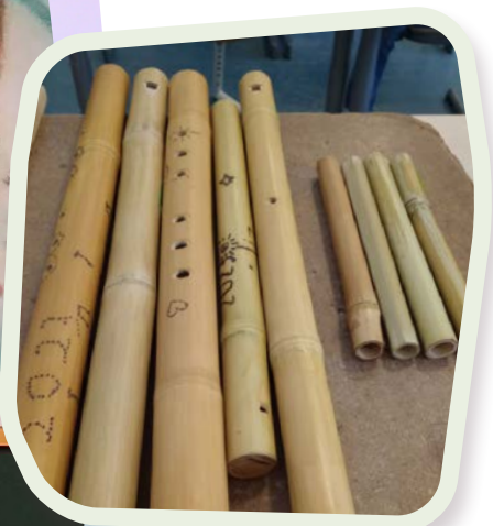
Bamboefluiten klas 4