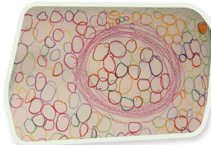
➤ Vormtekenen klas 1

Het CJG is een gemeentelijke voorziening waar ouders en jongeren terecht kunnen met vragen over opvoeden en opgroeien. Hierin werken verschillende organisaties samen die ouders en jeugdigen (van 0 tot 23 jaar) ondersteunen bij vragen over gezondheid, ontwikkeling, opgroeien en opvoeden. De gemeentelijke CJG's worden gesubsidieerd door het rijk.