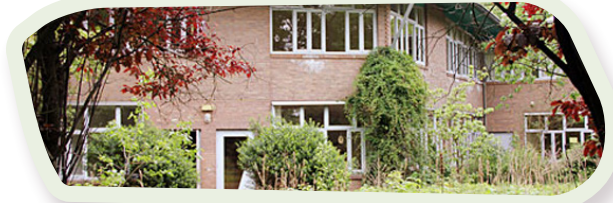
📍 Kinderopvang 't Kleine Volkje