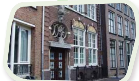
📍 Bovenbouw Waldorf Utrecht