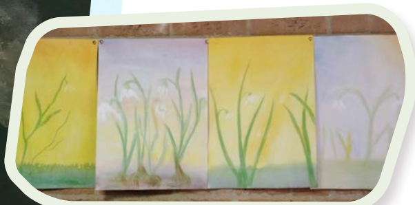
Sneeuwlokjes klas 6