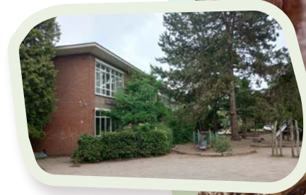
📍 Van Tuylaan